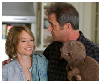
2011 LE COMPLEXE DU CASTOR (The Beaver) de Jodie Foster avec Mel Gibson