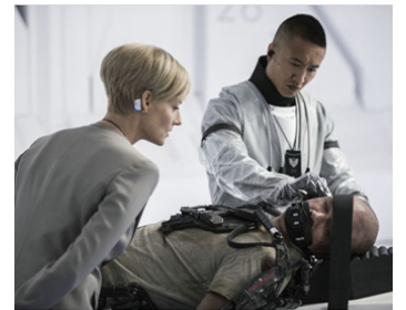
2013 ELYSIUM (Elysium) de Neill Blomkamp avec Matt Damon