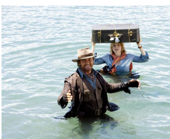
2008 L'ÎLE DE NIM (Nim's Island) de Jennifer Flackett et Marc Levin avec Gerard Butler