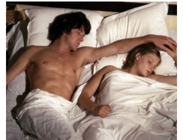
1977 MOI, FLEUR BLEUE d'Éric Le Hung avec Bernard Giraudeau