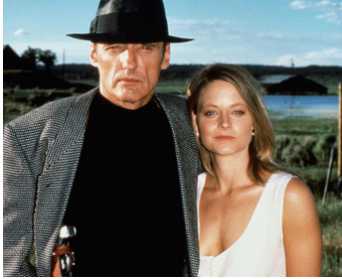
1988 UNE TROP BELLE CIBLE (Catchfire) d'Allan Smithee (D. Hopper) avec D. Hopper