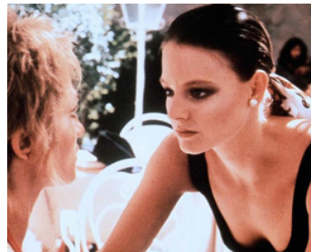
1987 SIESTA (Siesta) de Mary Lambert avec Ellen Barkin