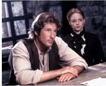
1993 SOMMERSBY (Sommersby) de Jon Amiel avec Richard Gere