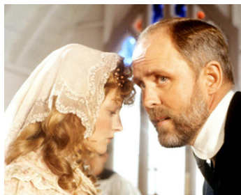
1986 MESMERIZED de Michael Laughlin avec John Lithgow