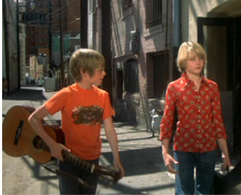
1974 ALICE N'EST PLUS ICI (Alice doesn't live here anymore) de M. Scorsese avec Lauran Dern