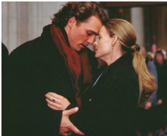
1997 CONTACT (Contact) de Robert Zemeckis avec Matthew McConaughey