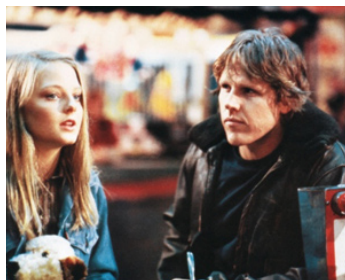
1980 CARNY (Carny) de Robert Taylor avec Gary Busey