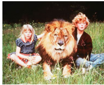
1972 NAPOLÉON ET SAMANTHA (Napoleon and Samantha) de Bernard McEveety avec J. Whitaker