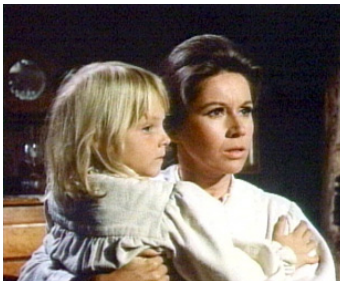
1970 MENACE ON THE MOUNTAIN de Vincent McEveety avec Patricia Crowley