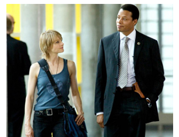
2007 À VIF (The Brave One) de Neil Jordan avec Terrence Howard