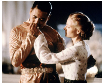
1999 ANNA ET LE ROI (Anna and the King) d'Andy Tennant avec Chow Yun-Fat