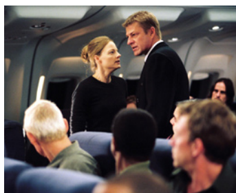
2005 FLIGHT PLAN (Flight Plan) de Robert Schwentke avec Sean Bean