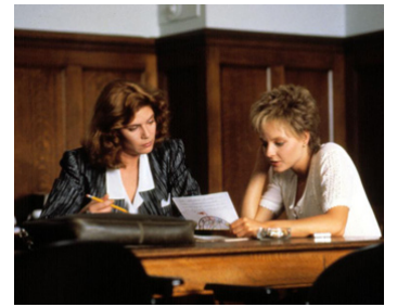
1988 LES ACCUSÉS (The Accused) de Jonathan Kaplan avec Kelly McGillis