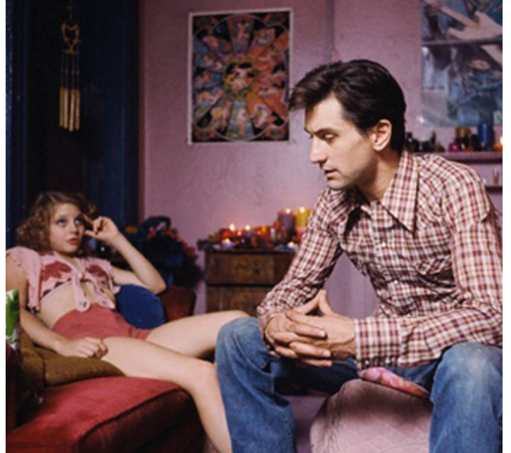
1976 TAXI DRIVER (Taxi Driver) de Martin Scorsese avec Robert De Niro