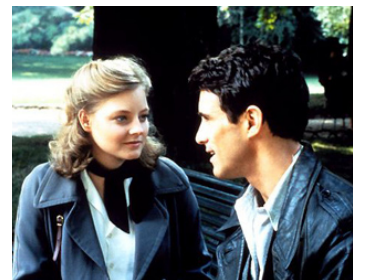
1984 LE SANG DES AUTRES de Claude Chabrol avec Michael Ontkean