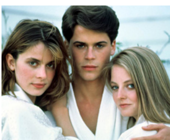
1984 HOTEL NEW HAMPSHIRE de Tony Richardson avec Nastassja Kinski, Rob Lowe