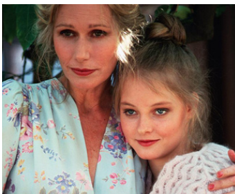
1980 ÇA PLANE LES FILLES (Foxes) d'Adrian Lyne avec Sally Kellerman