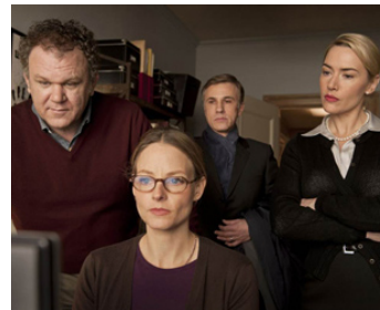
2011 CARNAGE (Carnage) de Roman Polanski avec John C. Reilly, Christopher Waltz, Kate Winslet