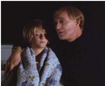
1976 ECHOES OF SUMMER (Echoes of Summer) de Don Taylor avec Richard Harris