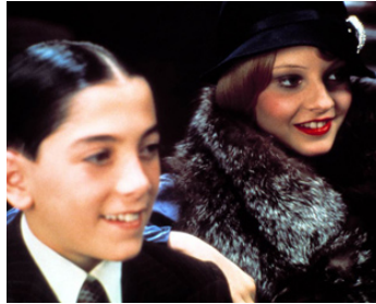
1976 BUGSY MALONE (Bugsy Malone) d'Alan Parker avec Scott Baio