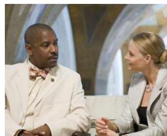
2006 INSIDE MAN, L'HOMME DE L'INTÉRIEUR (Inside Man) de Spike Lee avec Denzel Washington