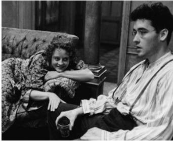
1992 OMBRES ET BROUILLARD (Shadows and Fog) de Woody Allen avec John Cusack