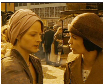
2004 UN LONG DIMANCHE DE FIANÇAILLES de Jean-Pierre Jeunet avec Audrey Tautou