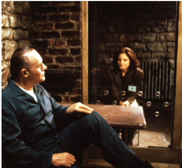
1991 LE SILENCE DES AGNEAUX (The Silence of the Lambs) de Jonathan Demme avec Anthony Hopkins