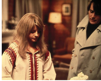
1976 LA PETITE FILLE AU BOUT DU CHEMIN (The Little Girl who lives down the Lane) de N. Gessner avec M. Sheen