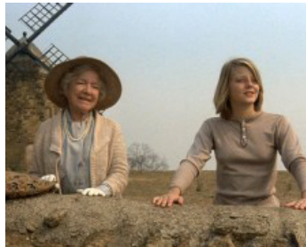
1977 LA COURSE AU TRÉSOR (Candleshoe) de Norman Tokar avec Helen Hayes