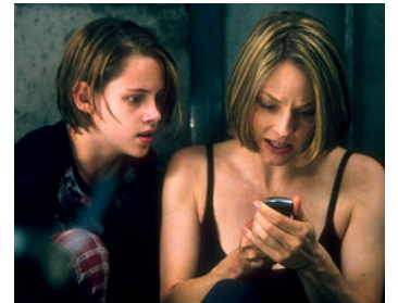
2002 PANIC ROOM (Panic Room) de David Fincher avec Kirsten Stewart