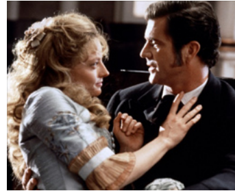
1994 MAVERICK (Maverick) de Richard Donner avec Mel Gibson