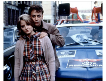
1987 FIVE CORNERS de Tony Bill avec Todd Graff